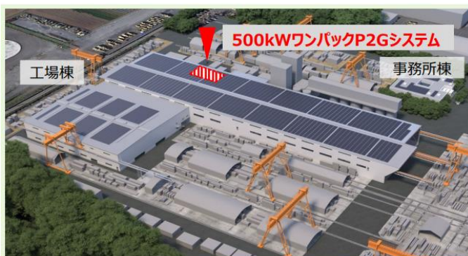
【大成ユーレック川越工場全景】